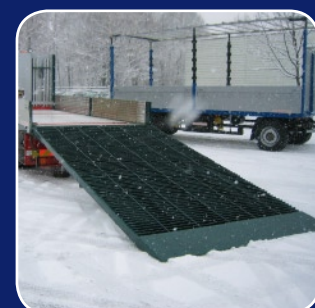
ZLR 6/11 to

Die robuste unterfahrbare ZEPRO Ladebordwand eignet sich besonders für Container, Koffer- und Kühlaufbauten. Die hohe Betriebssicherheit kombiniert mit der sehr einfachen Bedienung hilft besonders den Benutzern, die die Hebebühne nicht für jeden Ladevorgang verwenden.